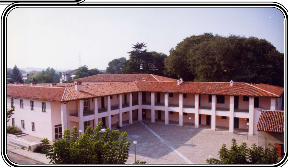
La seconda sede via Manzoni 20