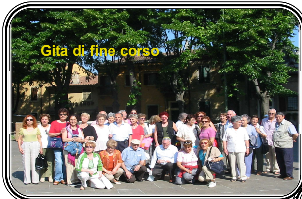
Gita di fine corso

scopi interni. L'ACFA-ACCADEMIA garantisce che, su richiesta, i dati personali potranno essere rapidamente cancellati o rettificati. I partecipanti per avere informazioni, sono invitati a telefonare in segreteria, dal lunedì al venerdì dalle ore 9,30 alle 11,30, al numero 02 25410219.