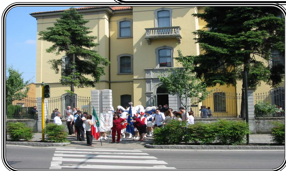
La sede di via Milano 3 da ottobre 2002