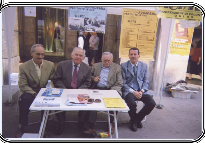
Partecipazione alla sacra del commercio 2022

Attualmente sono attivati i seguenti corsi: ABC del CUCITO - LINGUA INGLESE - LINGUA TEDESCA - SARTORIA PROFESSIONALE - GINNASTICA BIOENERGETICA - MAGLIA - RIFLESSOLOGIA DEL PIEDE - USO COMPUTER - FILOSOFIA - DECOUPAGE - CORSO DI PITTURA.