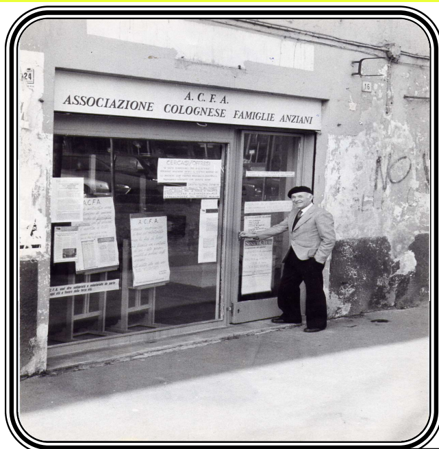
La prima sede Piazza Castello aperta il 12 maggio 1983