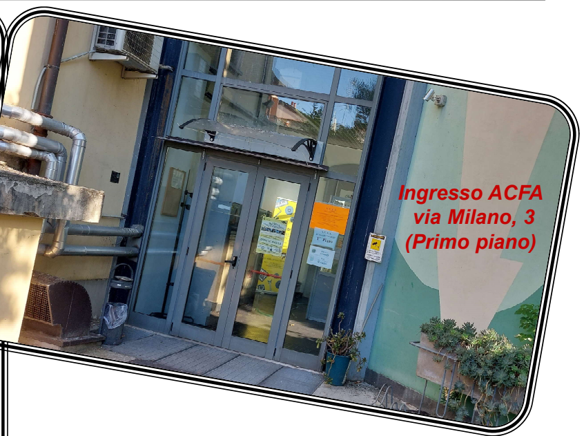
Ingresso ACFA via Milano, 3 (Primo piano)