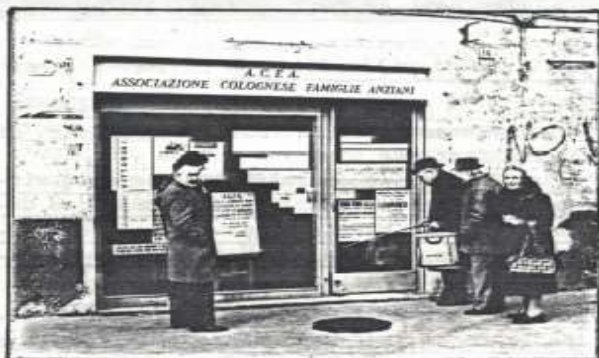
Nella fotografia : la sede A.C.F.A. di P.zza Castello n° 16

PROCURANDO NUOVE ADESIONI E CONTINUANDO A CONTRIBUIRE CON LA NOSTRA QUOTA