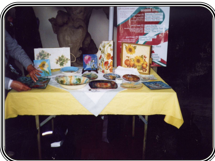
Manufatti prodotti ad un corso di Decoupage

L'ACFA-ACCADEMIA assicura che i dati personali dei partecipanti vengono trattati con tutta la riservatezza della legge in vigore (GDPR 196/2003) e vengono utilizzati solo per